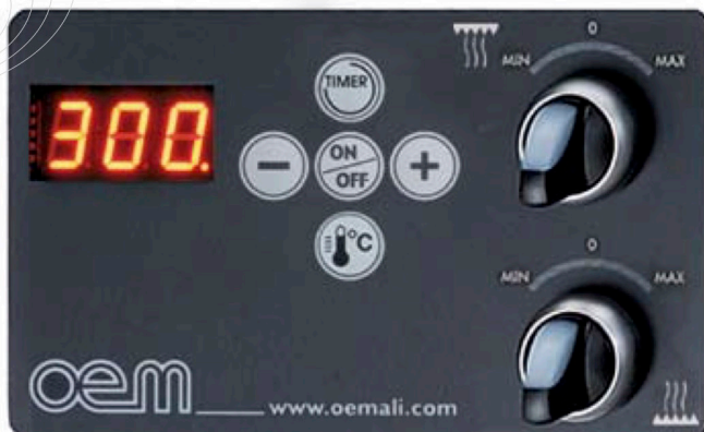
Pannello di controllo Control panel Panneau de contrôle Schaltfeld Panel de control